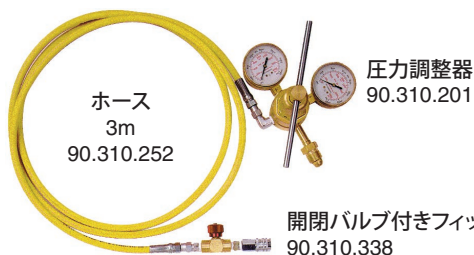
ホース 3m 90.310.252

自己封入式ガススプリングの充填には開閉バルブ付き高速充填アセンブリー(90.310.040)を充填バルブ(90.310.143)または圧力アナライザー(90.315.5)と合わせてお使いください。コントロールパネルと合わせて使えば配管式システムにも使用できます。90.310.040は圧力調整器(90.310.201)、ホース(90.310.252)、開閉バルブ付きフィッティング(90.310.338)が一体になっています。詳しくはDADCOへお問い合わせください。